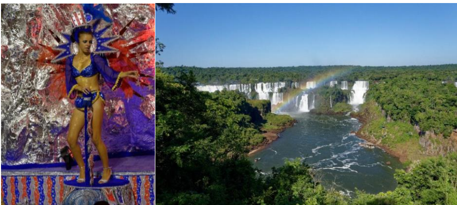
Carneval in Sao Paul - Die Wasserfälle in Foz do Iguacau

Klingt entspannt, aber ob ich dort länger arbeiten wollen würde? Höchstens für ein Jahr, denn Brasilien ist eine faszinierende Erfahrung, aber dann sehnt man sich doch nach der Ordnung, Sicherheit und zuweilen auch der Kälte Deutschlands – am heißesten Tag dort hatten wir über 40°C !