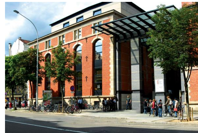
Université de Strasbourg